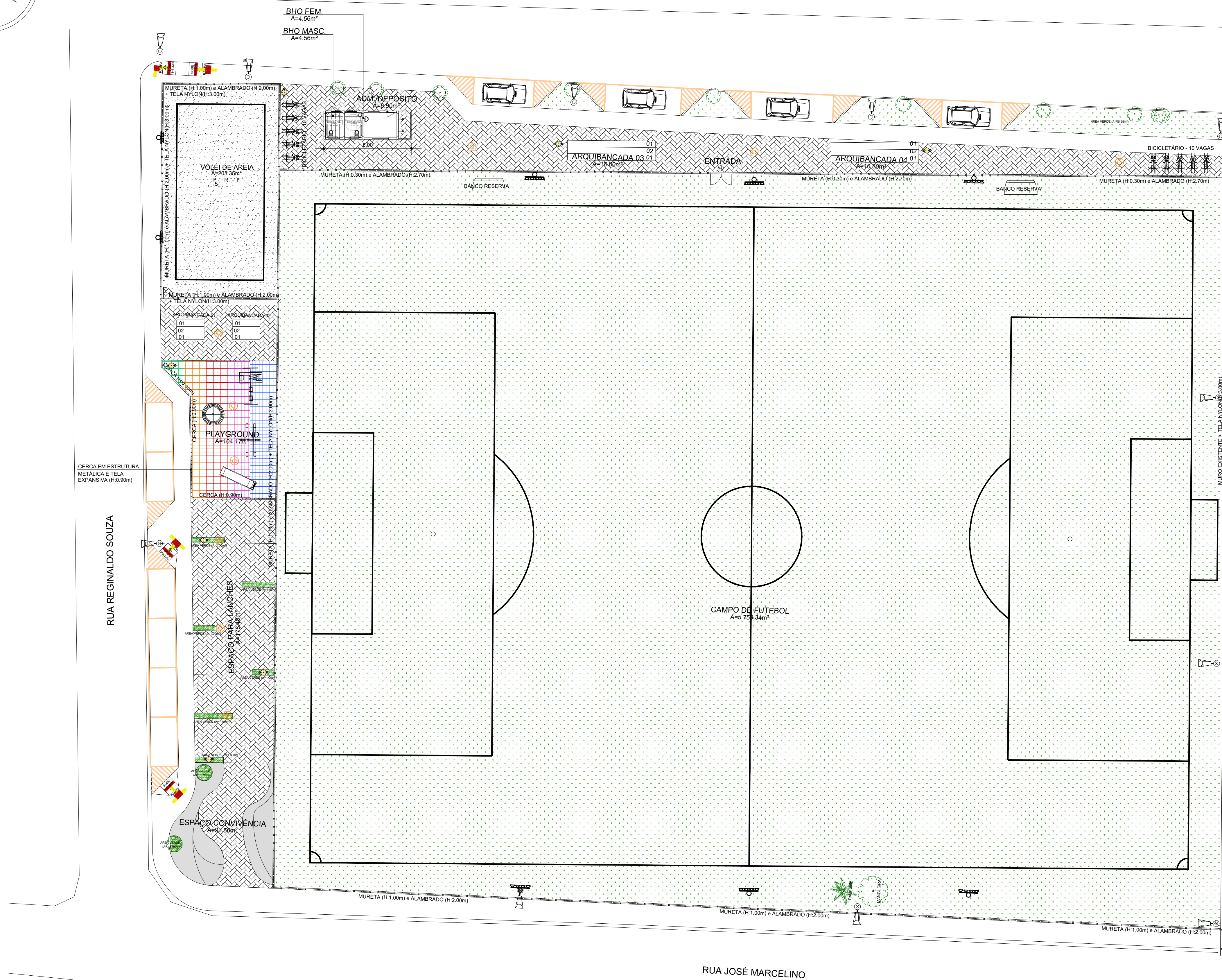
LAYOUT ESC. 1:200